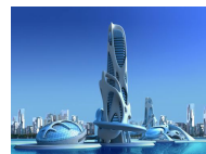
Zukunft der Arbeit im Kanal