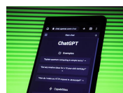
ChatGPT and LLMs